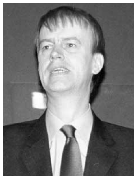
Bretska orkumálaráðharrin Stephen Timms heldur stórra dentur skal leggjast á at menna varandi orkukeldur. Her talar hann til 200 áhoyrarar í stóru samkomuhøllini í Lerwick

Eins og undanmaður hansara í orkumálaráðnum, Brian Wilson, so sær Stephen Timms eisini