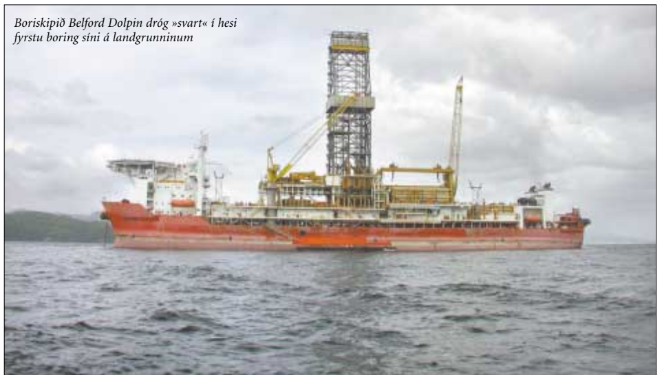
Boriskipið Belford Dolpin dróg »svart« í hesi fyrstu boring síni á landgrunninum

ingini kemur út. Tað verður helst nakað eftir ólavsøku.