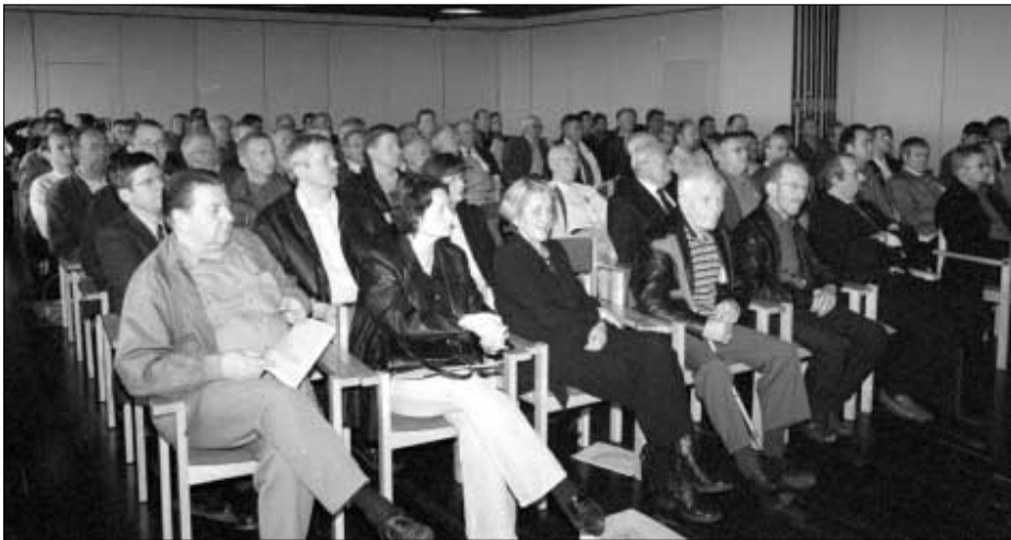
Nógv fólk hevði leitað sær til aðalfundin í føroyska oljufelagnum.

Við góðkenningini frá teim ensku myndugleikunum fór felagið formliga uppí samarbeiðið við Amerada Hess, British Gas og DONG viðvíkjandi tveimum av teim trimum loyvunum, ið vóru tillutað feløgnum í 19. enska útjóðingarfarnum í juni 2001 (P. 1027 & P. 1029 ið liggja í blokki 176/20 og 204/16 & 21).