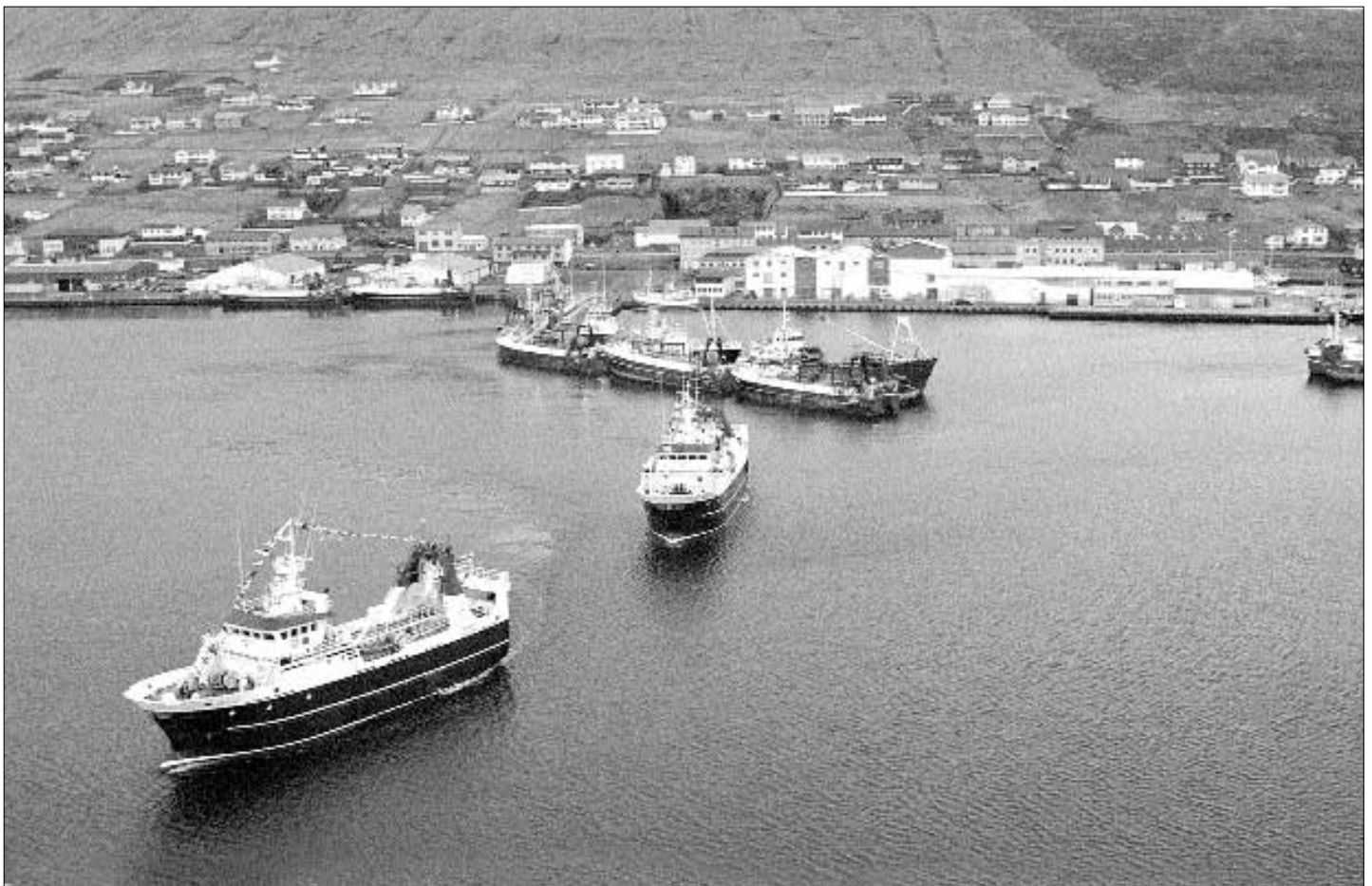
Fyrstu tríggjar mánaðirnar hevur tað roynst væl hjá teimum báðu nýggju trolarum hjá Beta, sum hava fiskað 1700 tons, men úrslitið hevði havt verið betri, um oljuprísurin ikki hevði havt verið so høgur

Fram til á heysti í 1973 kostaði oljan lítið. Tá var tað, at oljuprísirnir í kjalarvorrinum á Yom Kippur