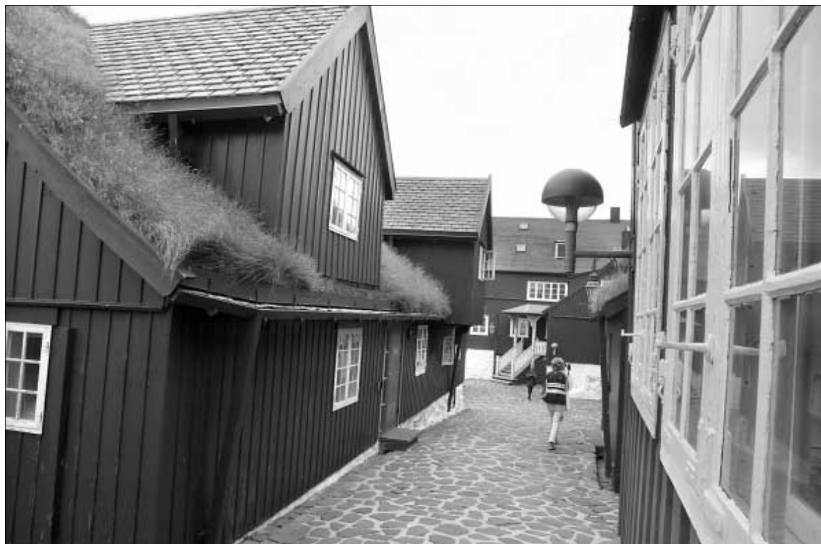
Almenna fyrisiting kostaði seks prosent meira fyrsta mánaðin í ár í mun til sama tíðarskeið í fjør. Almennu tænastr eru samlað voksnar við sje prosentum í januar.

Bytt verður upp í høvuðsbólkm, og har sæst, at størsti parturin av lønargjaldingunum eru í tæna-