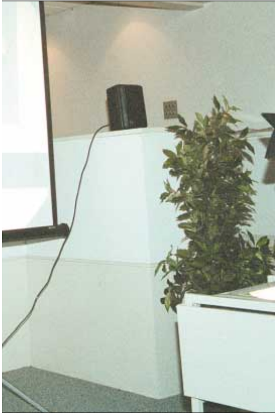
Framhald av síðu 14

viðurskiptini kunnu vera óðrvísi á teirra øki, sjálvt um tað er bara nakrar kilometrar burtur frá har BP boraði. Vit kunnu so ikki gera nakað annað enn at krossa fingrar fyri teimum.