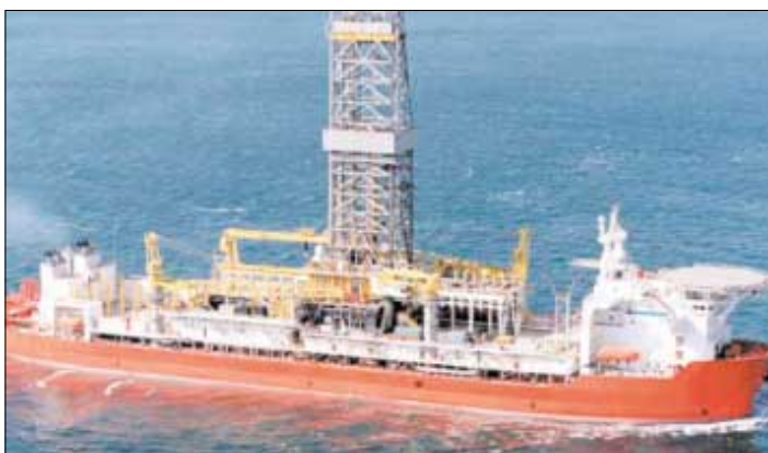
Belford Dolphin, sum skal bora fyri Agip í juni í feroyskum øki

koma nærri málinum. Fyri øll feløgini, sum hava lisenis á Atlantsmótinum, og tað merkir báðumegin markið, hevur boringin hjá ChevronTexaco tí helst sera stóran týðning fyri komandi boringar, og haraftrat kemur so boringin hjá Agip og Føroya Kolvetni. Hesar báðar boringar, hvørs úrslit vit fara at frætta nærri um um ikki nógvur mánaðir, kunnu eis-