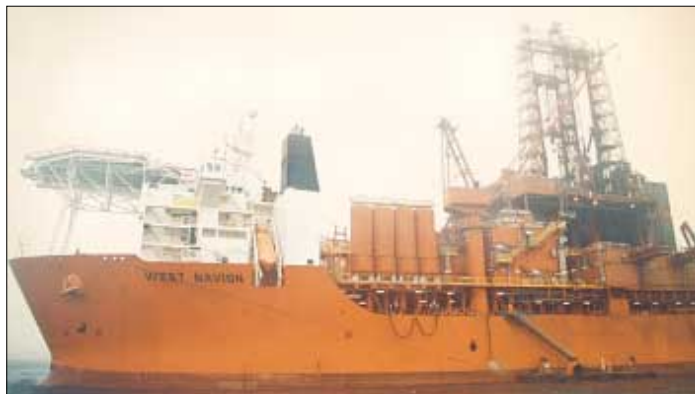
West Navion, sum skal bora fyri ChevronTexaco í mars skamt frá markinum

til at bora ikki so langt frá Assyntbrunninum og sjálvandi hava tey vánaliga úrslitið frá tí brunninum við í sínum metingum og fyrireikingum. Tað kann so eisini hugsast, at um ein slik "welltrade" avtala er gjord millum BP og Shell og Chevron Texaco, kann vera sera hent fyri BP og Shell, tí tey hava jú bundið seg til at bora tveir kanningarbrunnar aftrat í tí sama økinum, sum bæði Assynt og nú Fleet North prospektið hjá Chevron Texaco liggja í, tó at hesi liggja í hvør sínum blokki (loyvsteigi). Tað er eisini vanligt, at oljufeløg brúka boriúrlit hjá hvørjum øðrum til at