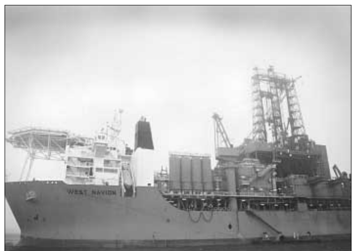
West Navion, sum hevur funnið olju nær markinum.

Socialurin hevur roynt at fáa viðmerking frá Amerada Hess í Havn og í London. Men har er púra tætt.