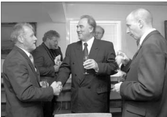
Umboð fyrri Oljumálaráðið hitta íslenska uttanríkisráðharran í Tinganesi

lítið virksemi er á føroyaøkinum fyrri tíðina, so halda fyrrireikararnir kortini, at hesin stevnu-táttur eigur ikki at verða tikin av. Avgjørt er at skipa fyrri einum temadegi fyrsta vikuskifti í desember. Tá verður gjørdur status millum oljufeløg og myndugleikar.