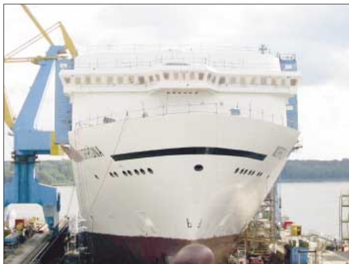
Enn er bert alt stál, men tað gongur skjótt

Nýggja Norrøna, sum alt Føroya fólk bíðar í spenningsi eftir – og vónandi eisini umheimurin – er nú við at gerast veruleiki. Leygardagin fer hon av bakkastokki í týska býnum Lübeck. Tilstaðar verða fleiri hundrad gestir, føroyskir sum útlendskir. Smyril Line vil við hesum roynd at marknaðarføra nýggju Norrønu, sum eftir ætlan skal fara í sigling í Atlantshavi næsta summer. Tað verður nógv gjørt burtur úr at fáa tíðindini um nýggja flaggskipið í NorðuratlantsHAVI