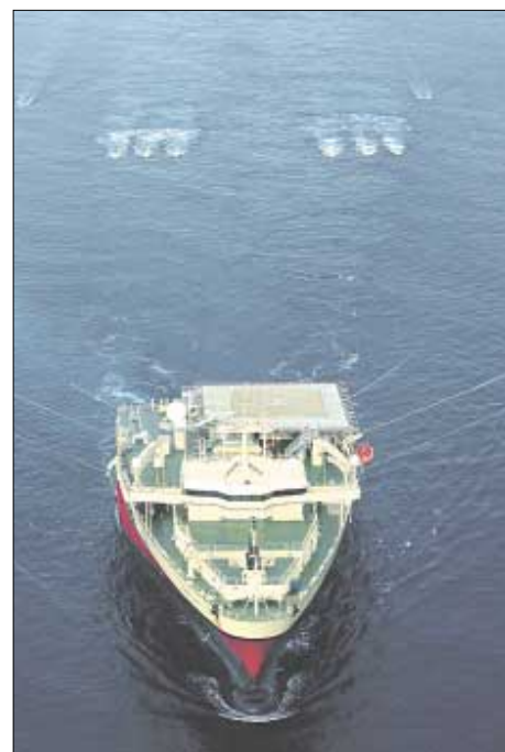
Ramform Valiant, eitt av heimsins mest framkomnu seismikkskipum í føroyskum sjógvum fyri Hess og Statoil

kanningar úr flogfari, hevur loyvi til at gera serstakar kanningar í føroyskum øki í ár. So talan er um rættliga umfevnandi seismiskt virksemd, sum í síðsta enda kann vera við til at hjálpa oljufeløgum at finna júst rætta staðið at seta framtíðar oljubarar í.