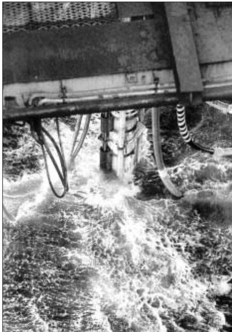
Frá fyrstu boringini hjá Hess í Føroyum við Sovereign Explorer

leika at koma uppi aftur. Greiðar reglur eru fyri slíkum. Hvat viðvíkur brunninum í bretskum øki, sum borast skal í juli, so er tað alt samtakið, ið stendur fyri honum, tvs. eisini BG. Hugsandi er at felagið móguliga bíðar eftir úrslitum av hesum brunninum. Verður tað gott, so kann hugsast, at felagið verður partur av øllum brunninum á Føroyaøkinum eisini.