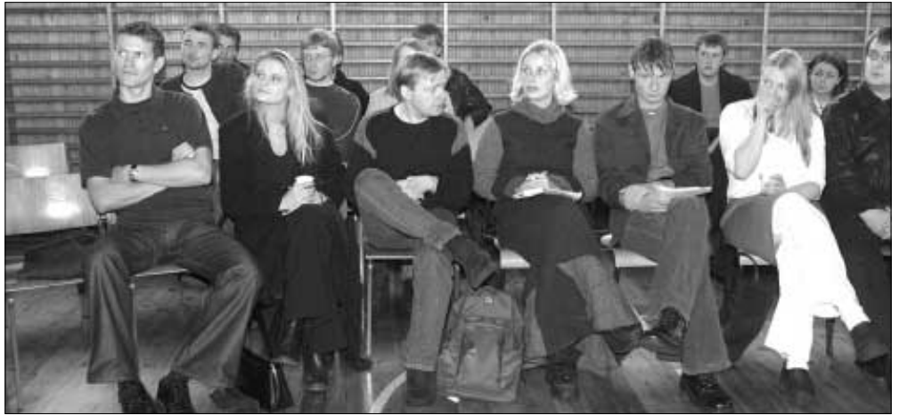
Fólkafloksungdómur mætti mannsterkur upp til ráðstevnuna á Háskúlanum um vikuskiftið

Ráðstevnan, sum politisku ungmanna-feløginu skipaðu fyri, eydnaðist, tá samanum kom, sera væl. Uppmøtingin var kanska ikki av tí allarbasta, og flestu luttakararnir vóru limir í ungmanna-feløgunum.