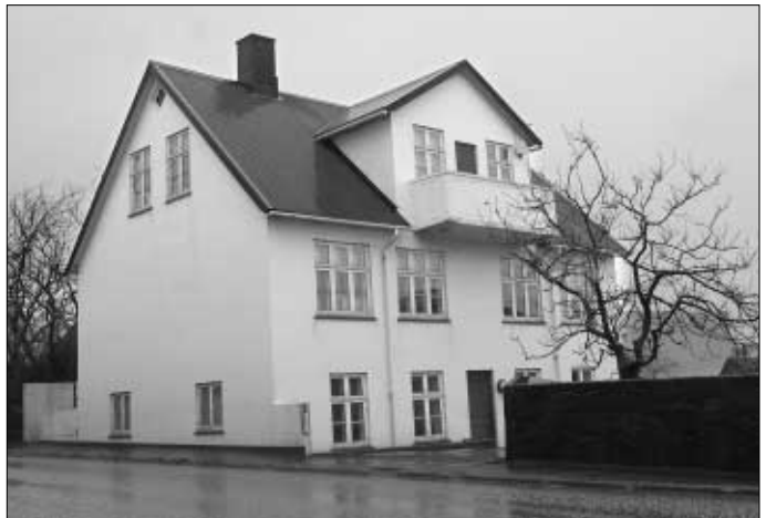
Søgu- og samfelagsdeildin á Fróðskaparsetrinum heldur til í hesum hølunum í J. C. Svabogotu í Havn

Higartil hevur tað sum heild verið so, at oljufeløg hava skula gjørt kanningar á tí øki tey fara inn á, tvs. hvørjar avleiðingar teirra virksemi hevur á fisk, umhvøvi osfr. Og so hevur