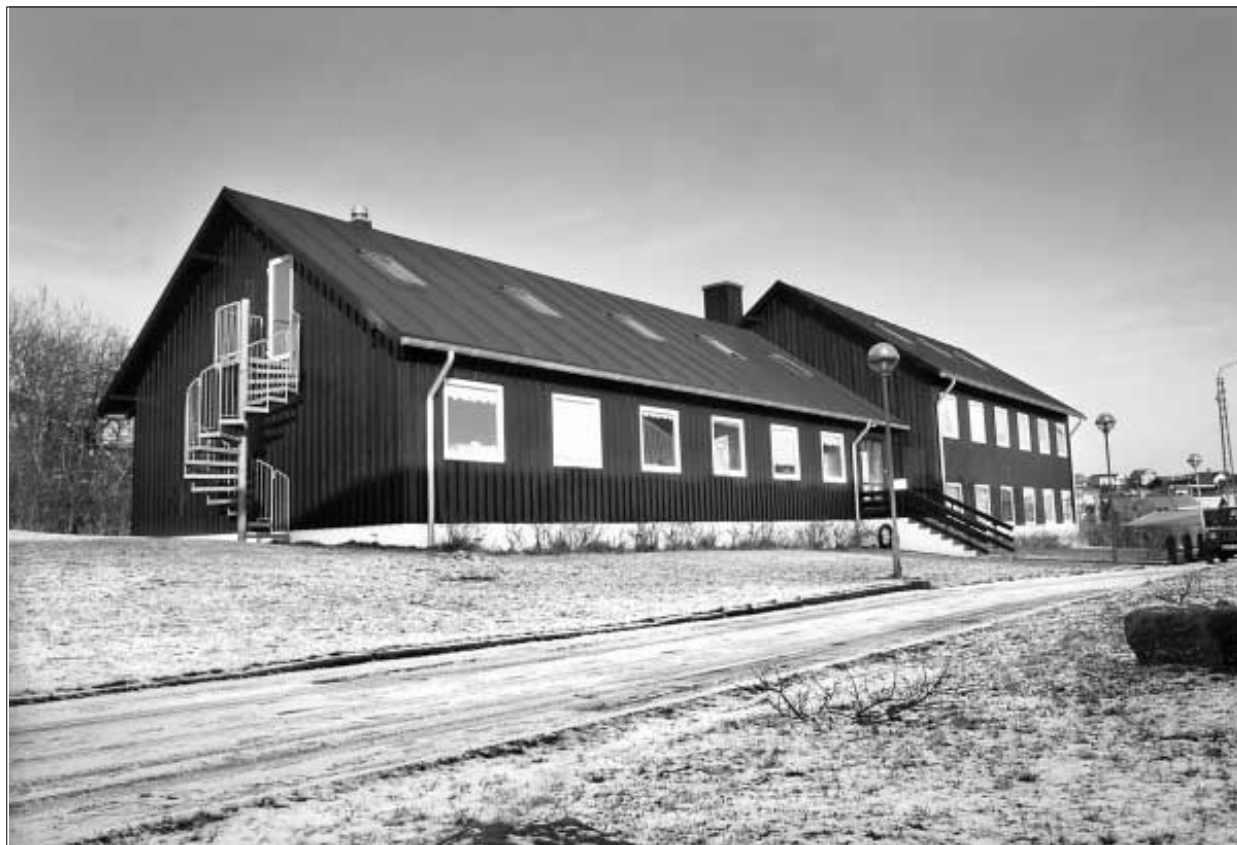
Frøðskaparseturið tørvar fólk og orku til at kunna fara meira miðvist undir granskingarverkætlanir

Lesið eisini í morgin um týðningin framtíðar granskingin hevur fyri føyroyska samfelagið.