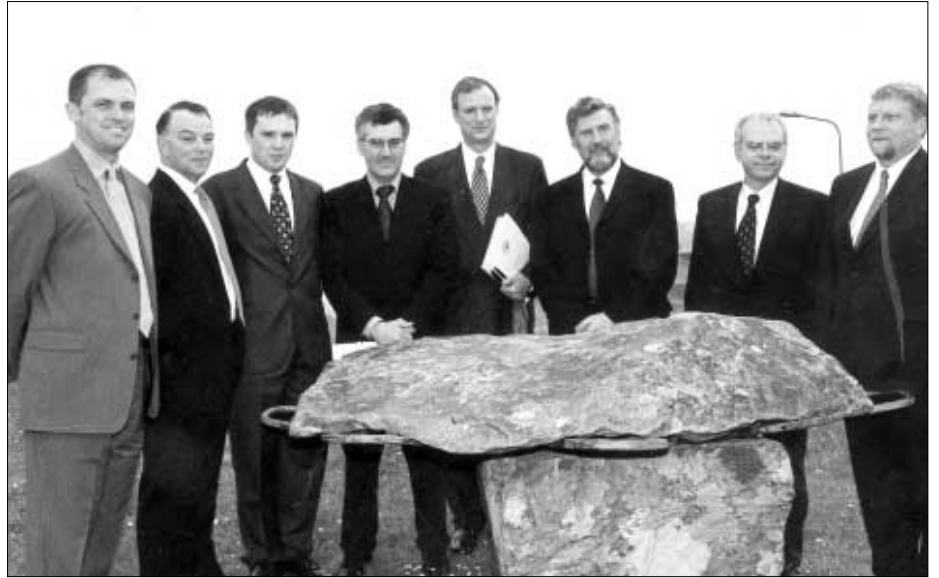
Fleiri av oddafólkunum í Agip og Føroya Kolvetni saman við oljumálaráðharranum

Vit vita so heldur ikki í lötuni, hvussu tað fer at eydnast Føroya Kolvetni at útvega kapital til at økja um sín part av loyvinum úr 7 upp í 22%. Hetta er so treytað av, at felagið megnar at tekna nógvan nýggjan