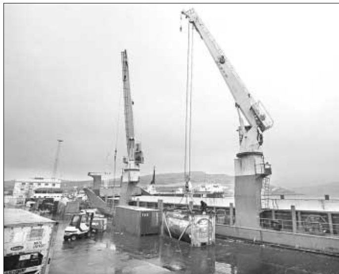
Uppgávurnar føroyskur veitingaridnaður fer at fáa frá oljuleitingarvirksemi á landgrunninum verða helst sera avmarkaðar komandi árin

Amerada Hess hevur so eisini eitt annað loyvi í bretskum øki m.a. saman við Texaco, sum eisini hevur fleiri onnur áhuga-verd loyvi í bretskum øki. Tað kann hugsast, at Texaco fer at bora í ár, eitt nú longur norðuri, har tað hevur eitt loyvi, sum liggur heilt uppat føroyska markinum, og har Agip hevur eitt 9 ára loyvi føroysku