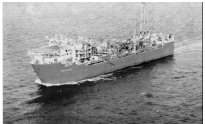
Terra Nova, framleiðslu- og goymsluskipið, sum nú er tikið í brúk á Grand Banks út fyri New Foundland

minni enn umleið 18 milljarðir krónur at byggja hetta