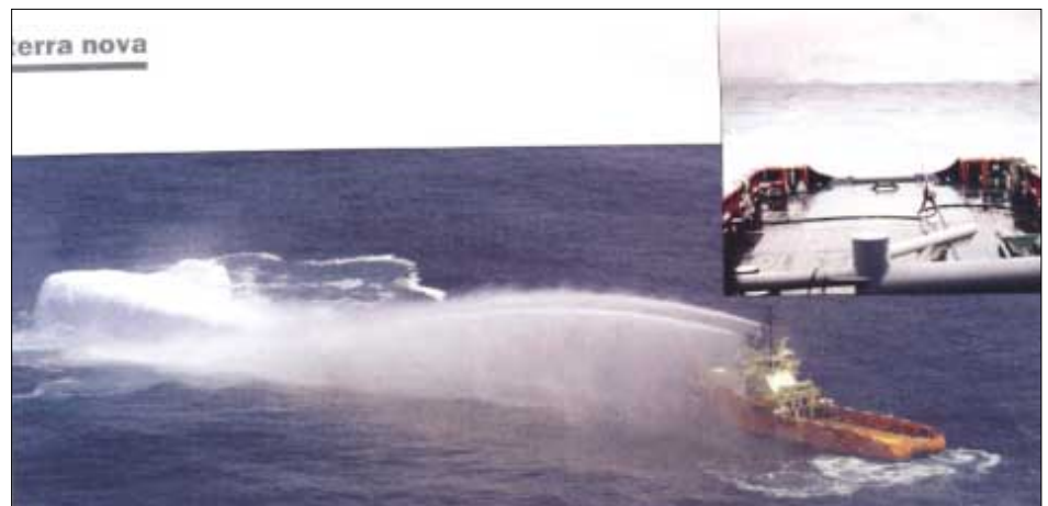
Nógv ísfjöll koma framvið oljuøkjunum út fyri New Foundland. Tá tey eru ein hóttan fyri oljuframleiðsluna verður endi settur á og tey verða togað burtur evni verða sprænd á tey

grunnar vit ikki eru ókend við, hava okkara áhuga, tá ein møgulig útbýgging fer í gongd her hjá okkum eisini. Har hava teir longu fingið sínar fyrstu royndir við at menna tvey oljufelt, eitt nú einum palli og eitt við einum skipi. Viðurskifti, sum eisini oljuvinnan um okkara leiðir kemur at taka støðu til, tá staðfest er, um felt eru lönandi her.