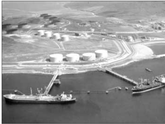
Oljuhavnin í Sullom Voe í Hetlandi, sum um 3-4 ár fer at taka ímóti fyrstu oljuni frá risastóra oljufeltinum Clair

Hetlendingar eru sera fegnir um avgerðina at