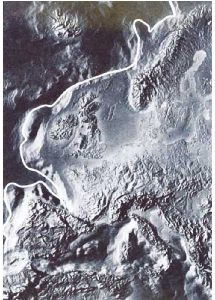
Á hesum kortinum síggja vit (hvíta strikan), hvussu víða Atlantsmótið, Atlantic Margin, gongur. Føroyar liggja mitt í.

Umframt BP/Shell fara eisini fleiri onnur oljufeløg at bora stutt frá markinum næsta ár, sum part av tillutan teirra í 19. rundu. Amerada Hess fer at bora tveir brunnar tætt upp at markinum við møguleika at bora enn ein. Agip fer at bora ein (umframt tann á føroyska økinum). Henda fingtu teir tillutað í 17. rundu. Texaco fer so eisini at bora ein ella fleiri brunnar stutt frá markinum. Hartil kemur, at Phillips stendur til at bora ein brunn suður úr markinum. So tá tað verður tosað um, at "bert" ein brunnur verður boraður á føroyska landgrunninum næsta ár, so er tað ikki allur sannleikin um Atlantsmótið sum so. Tað verða nevniliga boraðir