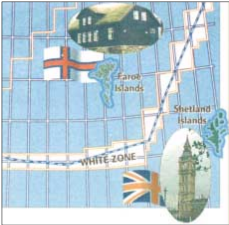
Útbjóðingar í Havn og í London frá stóra økinum á Atlantsmótinum hava stóran týdning fyri framtíðina her um leiðir, um talan verður um eina stóra oljuprovins eins og Norðsjógurin

báðumegin miðlinjuna, tess skjótari og blígari verður at fara undir eina útbygging, sum peningaliga ber einum infrastrukturi so sum rørleiðingsskipanum.