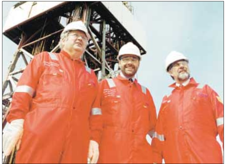
Politikarar eru fyrimynd, tá tað snýr seg um at nýta hjálmar

fólkunum trygdarhjálmar, tá arbeitt verður, eins og skelti skal vera á arbeiðsplássinum, sum upplýsir um hetta. Arbeiðspláss og virkir, sum kunnu vænta sær vitjan av Arbeiðseftirlitinum eru: