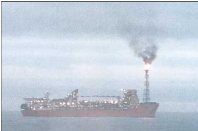
Framleiðsluskipið á Schiehallionfeltinum einans góðar 20 fjórðingar frá staðnum, har West Navion nú borar