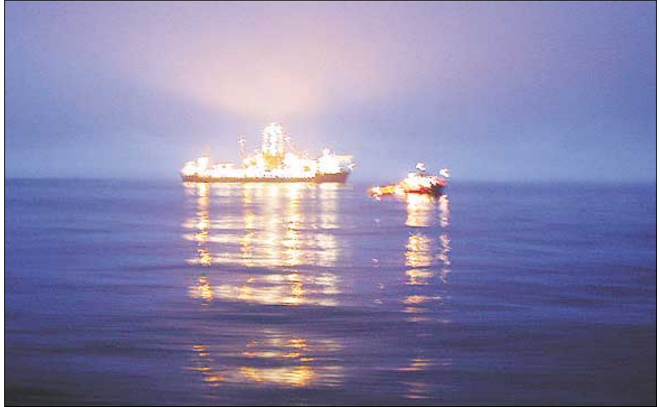
West Navion og hjálparskip farin til arbeiðis á føroyska landgrunninum

Tað var ongantíð ætlanin hjá BP og Shell, at tíðindini um oljufundið skuldu leka so skjótt út. Eitt nú vórðu