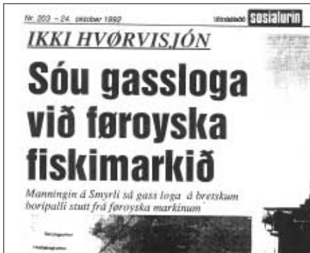
Stórtíðindi í fjølmiðlunum fyrri skjótt 10 árum síðani, tá manningin á Smyrli sá gassloga frá boripalli stutt frá leiðunum, har tað nú verður borað á føroyska øki

Eftir fyrst í skýmingini at hava siglt framvið goymslu- og framleiðsluskipinum á Foinaven og Schiehallion oljufeltunum bretska megin markið, har gasslogarnir stóðu upp í loft, og har einir fyra til fimm stórir pallar eisini boraðu, varð siglt um nógv umstrídda markið. Umleið ein tíma seinni komu vit í dýrdarveðri fram á West Navion, sum lá stilt í sjónum og heilt upplýst í kvöld-