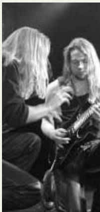
Ormurin langi er tann sangurin hjá føroyskum bólkum, sum hevur staðið seg best á 15 teimum bestu

Hóast Týr hevur tikið metið hjá føroyskum bólkum, so skal nógv til, áðrenn bólkurin kann taka metið frá amerikanska rockbólkunum, Bon Jovi, sum hevur