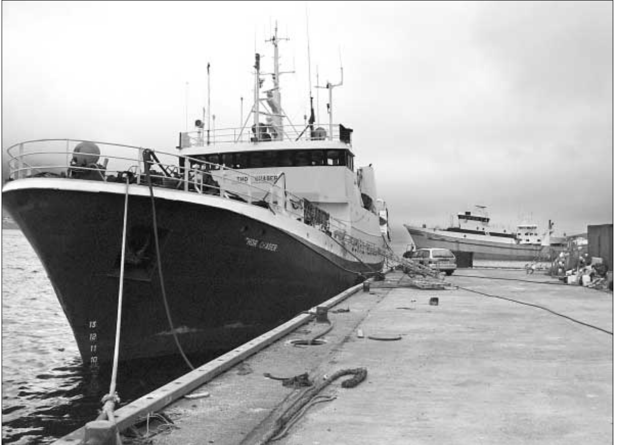
Svenski trolarin Torland, sum Esvagt hevur keypt, verður umbygdur á Skála, og fer, tá hann er liðugur, at eita Esvagt Supporter

Skipið kom á Skála tann 6. juni og skal vera liðugt umbygt tann 6. november. Umbyggingin umfatar niðurtøku og reinsan av skipinum so at siga, áðrenn bygt verður upp aftur og innrættað, sum nýggju eigararnir vilja hava skipið.