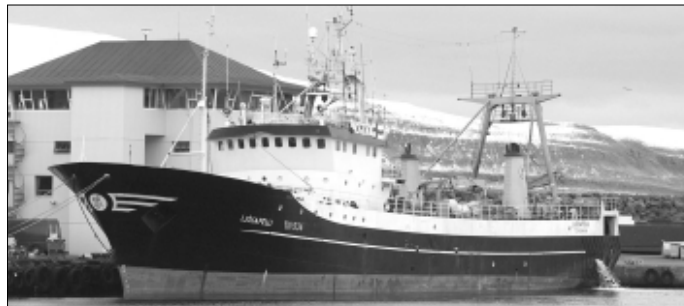
Ljósafelli, ein av kongafiskatrolarunum

– Eitt er so staðfest, kongafiskaveiðan undir Føroyum minkaði úr 15.000 tons um og niður í 7000 tons so skjótt, sum av álvara varð