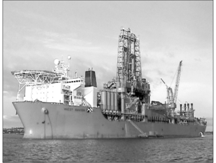
Boriskipið West Navion, sum eisini borar vestan fyri Írland, og sum – gongst sum ætlað – helst kemur í føroyskt øki í seinnu helvt av juli ella tíðliga í august at bora ein brunn.

Tá tosað verður um oljuleitning, hevir tað sjálvandi mest at siga, at feløgini finna olju. Men partar av avtaluni millum myndugleikarnar og oljufeløg snúgva seg eisini um, at feløg, sum bora, skulu kunna útvega føroyskum myndugleikum vitan og upplýsingar um undirgrundina sum heild.