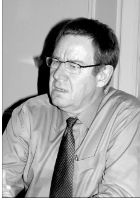
Blokkurin verður burtur í 2005, um føroyska sjálvstýrissamtyktin stendur við. Hetta eru nýggjastu hørdu boðini frá danska forsætisráðharranum

Poul Nyrup Rasmussen hevur fleiri ferði gjørt