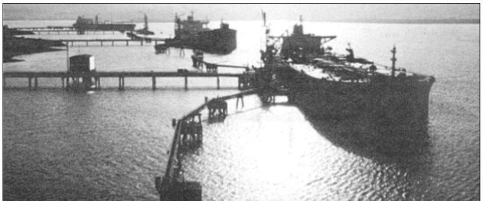
Sullom Voe er størsti oljuterminalin í Europa. Hann kann taka 1,2 mill. tunnur av olju um dagin, men í løtuni tekur hann um 600.000 tunnur. Úttil eru kortini út til at oljuhavnin fer at verða nógv meira brúkt

– Hetlendingar hava livað við oljuvinnuni í 25 ár. Hon hevur ávirkað samfelagið nógv. Hetlendingar halda