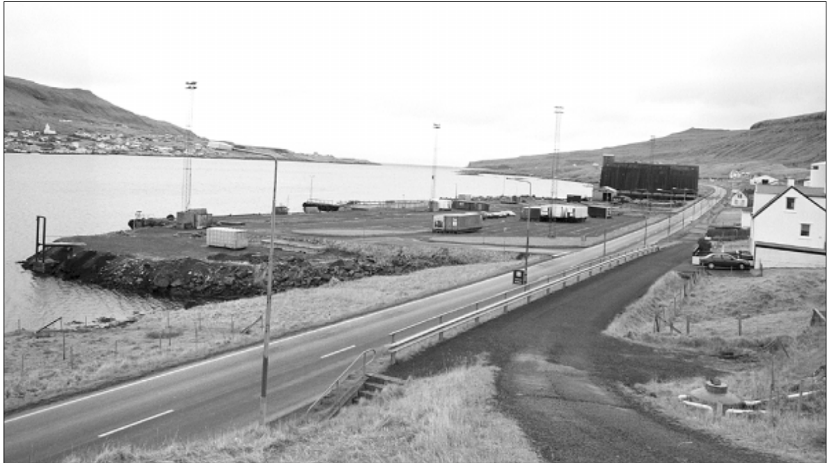
Á Tvøroyri hava tey nú í fleiri ár lagt sera stóra orku í at Drelnes skuldi verða oljuhavn. Eitt nú tóku tey seg saman við ein risa á økinum, Danbor Service, sum er eitt dóttirfelag hjá AP Møller og sum hevur yvir 20 ára royndir í oljuvinnuni. Men alt hetta tykist nú at vera til fánytis

Tvøramenn hava annars seinastu árin lagt eitt ovurhonds stórt arbeiði í át fáa oljuhavnin til Tvøroyr. Men nú sær tað so út til, at alt hetta arbeiðið er til fánytis.