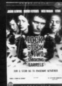
LOCK STOCK AND TWO SMOKING BARRELS