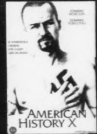
AMERICAN HISTORY X