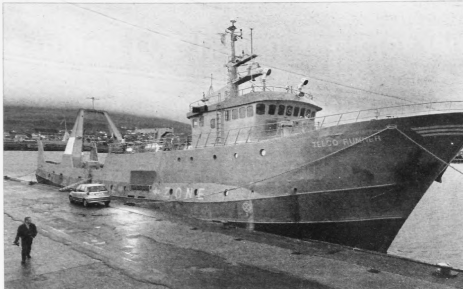
Hetta skipið hjá niðurlenska reidartíðnum Telco hevur nú litið á Havnini í ein mánað. Og tað er ein sigandi mynd av stóðuni í frálándavinnuni í lotuni. Virksemd er nógv fallið í øllum Norðsjónum seinastu mánaðirnar og tað hevur millum annað kostað einum hópi av føroyingum arbeiðið

Men felagið, sum aftur eigur Telco, hevur eini 70 skip í frálándavinnuni.