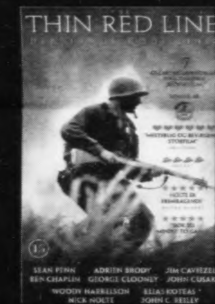
THIN RED LINE