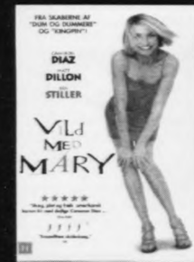
VILD MED MARY

Leiga videofilmar á hesum stöðum: Statoilstøðin í Gundadalí tel. 314770 Statoilstøðin í Kollafirði tel. 421083 Statoilstøðin í Saltangará tel. 449133 Statoilstøðin í Klaksvík tel. 457353 Statoilstøðin í Sørvági tel. 332001 Statoilstøðin í Skálabotni tel. 441200 Statoilstøðin í Leirvík tel. 443360