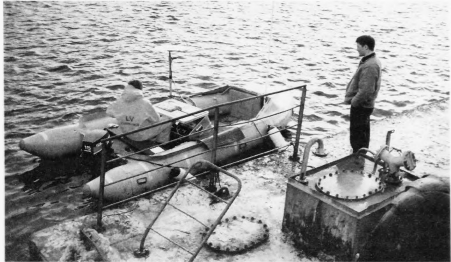
Seinastu dagarnar hava fólk frá Landsverkfrøðinginum gjørt dýpdarmátningar á Trongisvágssfirði at kanna móguleikarnar fyri at gera nýggja ferðafólkahavn, nú havnin, sum er á Drelnesi, skal brúkast til oljuhavn

Endamálið við kanningum er at vita, hvussu móguleikarnir eru at flyta ferjuleguna, sum er á Drelnesi, so at nýggja ferðafólkahavn