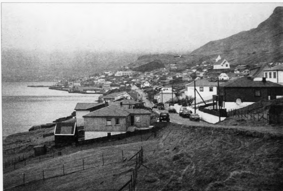
Á Tvøroyri spæla tey upp á allar streingir fyri at brynja seg til ta komandi oljuvinnuna. Tað seinasta er, at Tvøroyrar Kommununa nú knýttir vinabýarsamband við tveir aðrar norðurlenskar oljubýir

– Sola liggur heilt uppat Stavangri, størsta oljubýi í Noregi, og ein partur av oljuvirkseminum í Stavangri rökkur eisini inn í