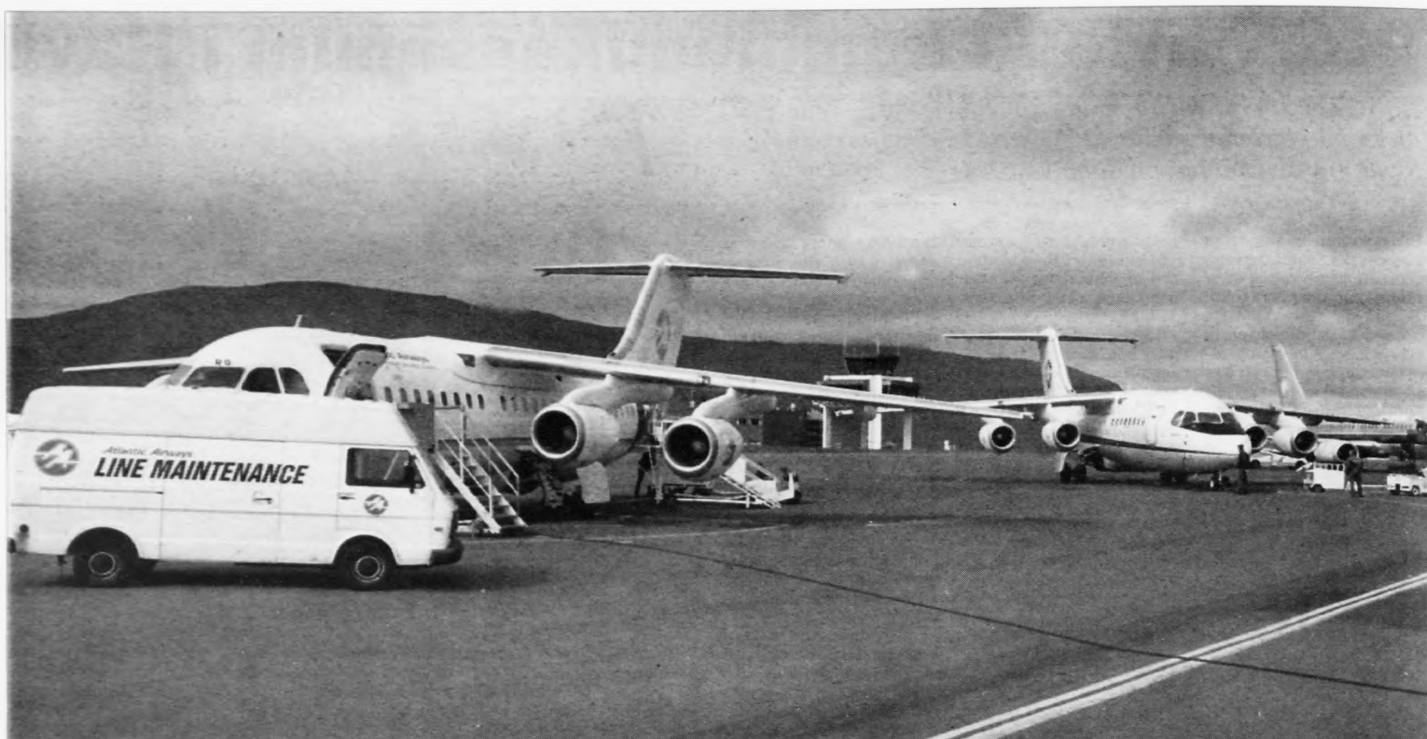
Sjaldsom sjón á flogvöllum í Vágu: Tveir flogfórnir hjá Atlantsflog og eitt flogfar hjá Mærsk