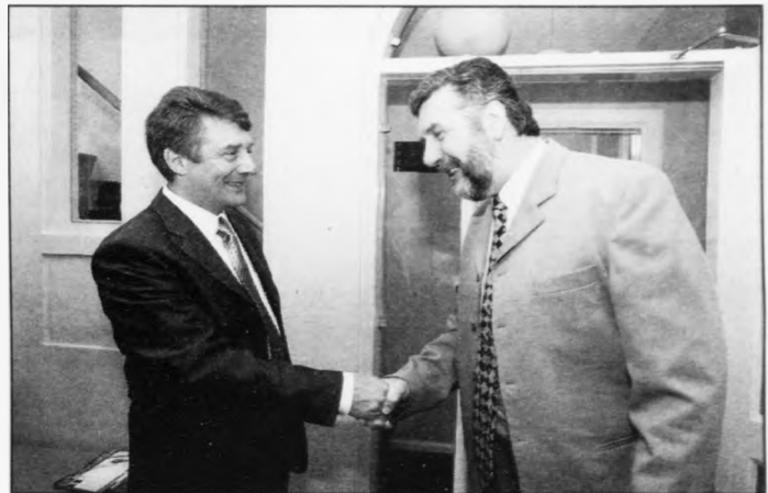
Tað er ikki minst marknaemjan millum Føroyar og Bretland, sum hevur skundað undir ætlaninar at seta á stovn eitt sjálvstøðugt oljumálastýri.