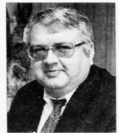
fyrri at fara undir eina leiting - og ikki minst at geva oljufeløgnum umstøður til at virka.

Eg má siga, at tað er ótrúliga gott, at oljufelgini hava víst slíkt tol, sum tey hava í hesum tíðarskeiðinum, og eg eri ótrúliga glaður fyrri, at hetta málið nu er løyst, og at man ti kann fara undir alt tað stóra praktiska arbeiðið, sum er nevndugt