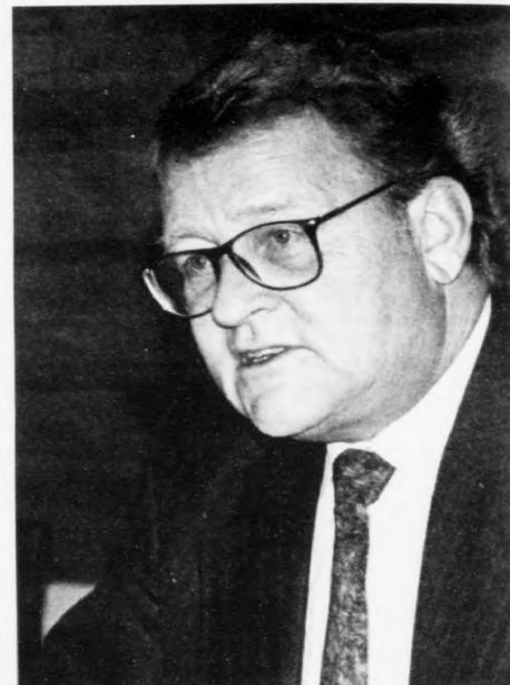
Niels Helveg Petersen, danski uttanríkisráðharri, kemur til Føroyar at undirskriva marknaavtaluna