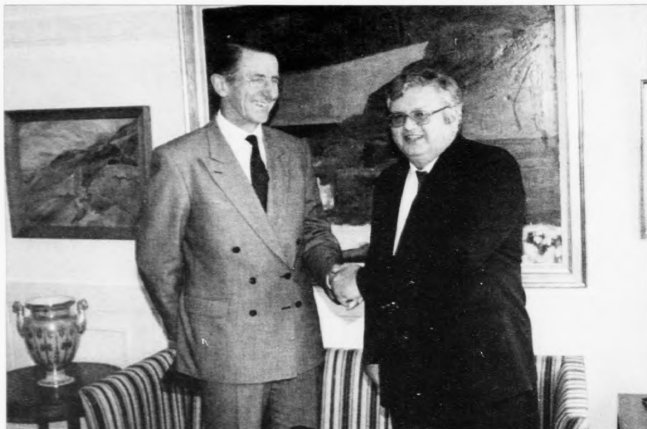
Anfinn Kallsberg, lögmaður, hittir her bretska sendiharran í Keypmannahavn. Við nýggju avtaluni eru lunnar lagdir undir nýtt tramtíðarsamstarv millum Føroyar og Bretland