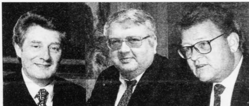
Tony Lloyd, bretska varuttanríkisráðharrin, Anfinn Kallsberg, lögmaður og Niels Helveg Petersen, danski uttanríkisráðharrin. - Eg eri væl nøgdur við avtaluna, sum kann vera við til at økja um samvinnuna millum Føroyar og Bretland, sigur lögmaður