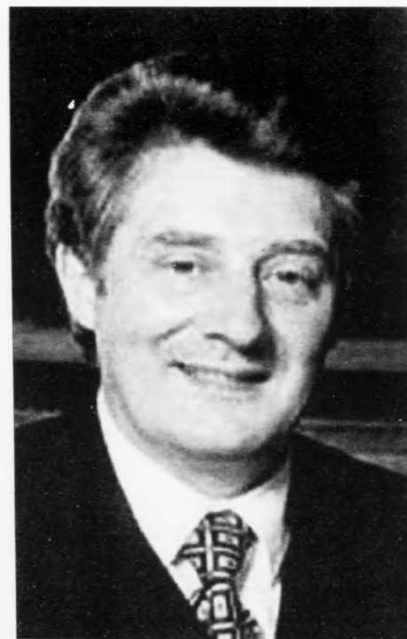
Tony Lloyd, bretscur varau- ttanríkisráðharri, kemur til Føroya við RAF flogfari mánadagin 17. mai til at skriva undir avtaluna dagin eftir

Anfinn Kallsberg upplýsir, at hann hevur heitt á lögtingsformannin um at kalla tingið saman, soleiðis at avtalan kann verða lögð fyri tingið mánadagin 10. mai. Henda dagin verður eisini tíðindafundur, har avtalan verður almannakunngjord. Ætlanin er at fáa málið avgreitt á tingi í seinasta lagi 17. mai. Og dagin eftir verður so avtalan undirskrivað. Síðani verður av-