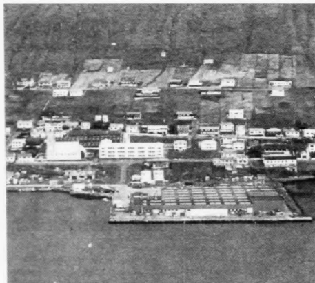
Útgangsstøðið hjá royndini hjá Vágs Skúla er, at støðið skal takast í teimum evnum, sum hvør næmingur hevur

Hendan hugsjónin er beinasteyrin í eini roynd.