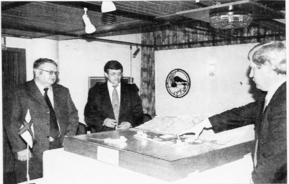
Suðuroyingar hava grivið stríðsoksinu og hava tikið eitt stórt stig framá í royndinum at menna oynda. Nú verður alt vinnulivið í Suðuroynni savna undir ein hatt í oljvinnuni.

oynda, fáa øll gagn av henni bæði sunnaliga og norðaliga.