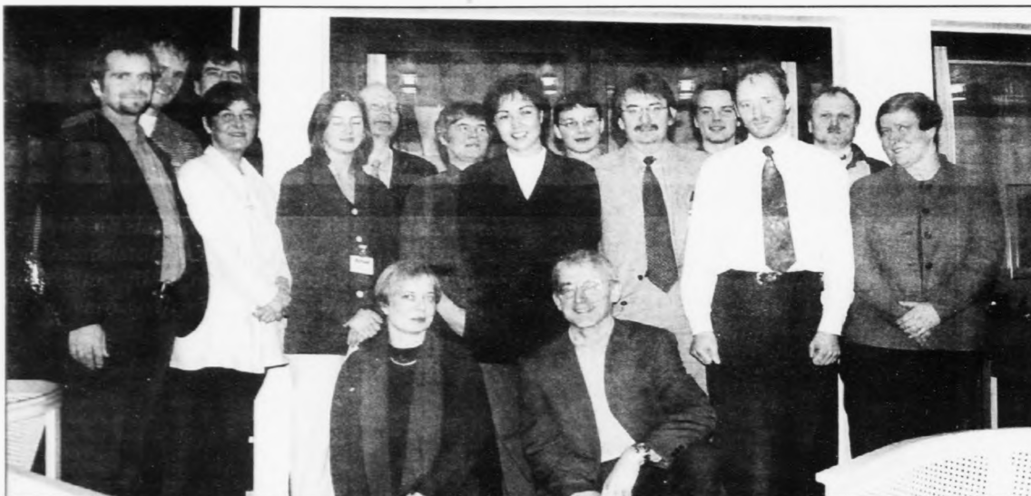
Umboð fyri fleiri føroyskar stovnar m.a. Biofar, Heilsufroðiliga Starvsstovuna, Fiskirannsóknarstovuna, Tórshavnar Havn og Oljufyriritinginavórðu við á skeiðinum, sum danska Dong skipaði fyri herfyri.