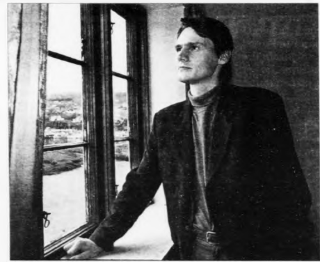
Hogni Hoydal, landsstýrismaður, ger viðmerkingar til málið um uppsøgnina av landsverksfrøðinginum

Hartil er at siga, at Tjóðveldisflokkurin – og helst flestu samgongulimir – hava stóra víðing fyrri tí arbeiði og vitan, sum Landsverksfrøðingsstovnurin hevur útint. Sjálvsagt skulu vit tryggja, at vitan og forleiki er á føroyskum hondum, og sjálvsagt skal onki syndrast, men heldur byggjast upp. Men broytingarnar kunnu og skulu sjálvsagt gerast til tað betra, um