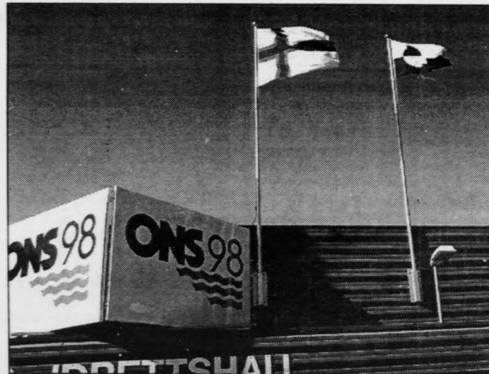
Bæði Føroyar og Grønland høvdu bás á altjóða oljuframsýningini í Noregi herfyri.

Grønlandska heimastjórin var við á oljuráðstevnu í Stavanger herfyri. Og her inngongur Dong sum ein fjórði partur í leitingini eftir olju og gassi.