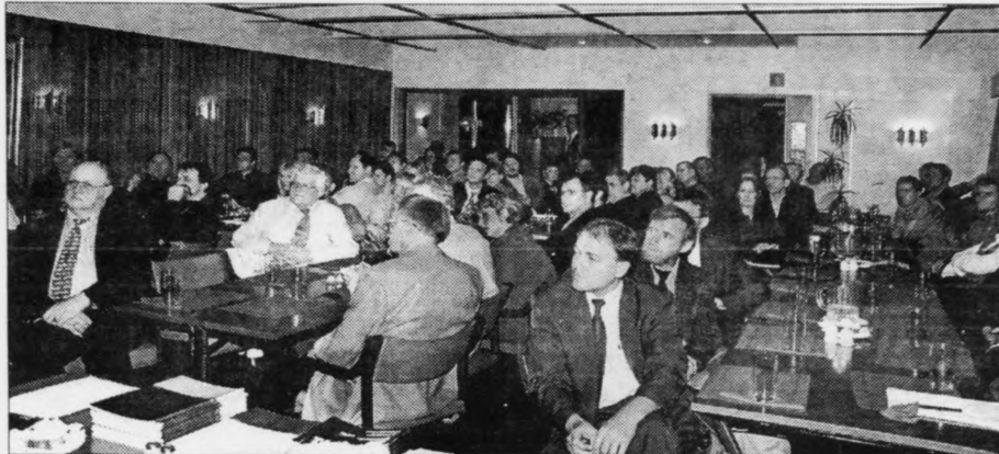
Stórir áhugi var fyri fundinum, sum Føroya Arbeidsgevarafelag skipaði við lutløkuni av oljufelagnum Dong, sum er partur av The Faroes Partnership oljufelagnum. Mynd jan