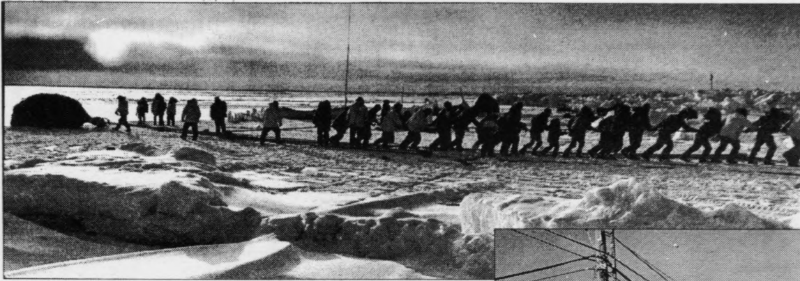
Stórhvalur hefur í fleiri túsund ár verið miðdepin í lívinum og mentaninni hjá Inupiatfólkinum.