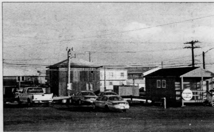
Byarmynd úr Barrow. Alt er sandur. Húsin standa á pelum orsakad av permafrostinum. Hóast vegirnir eru vánaligir og fáir, so eru nógvir dýrir bilar har