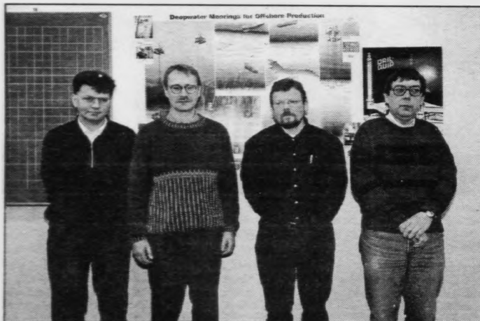
Fyra av lærarunum, sum undirvísa á fyrsta oljuboriskeiðinum í Føroyum