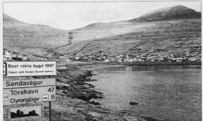
NAP skal hava tvær skrivstovur, harav onnur teirra skal verða í Sandavági. Hon fer at halda til í kommunuskrivstovuni

Og um nýggja oljuloggávu, sigur stjórin, at uttan neyðug tilføk, sum gera okkum til reiðar at veita