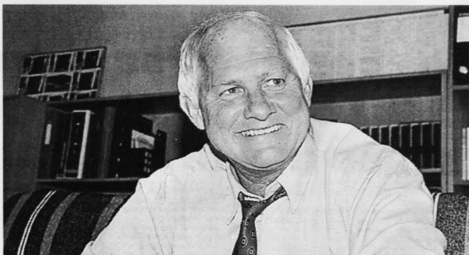
Svend Auken- Latíð okkum gloyma fortíðina og hyggja framefir

Annars vísir dansk orkumálaráðharrin á, at bretar tykjast vilja hava markið uppá pláss sum skjótast.