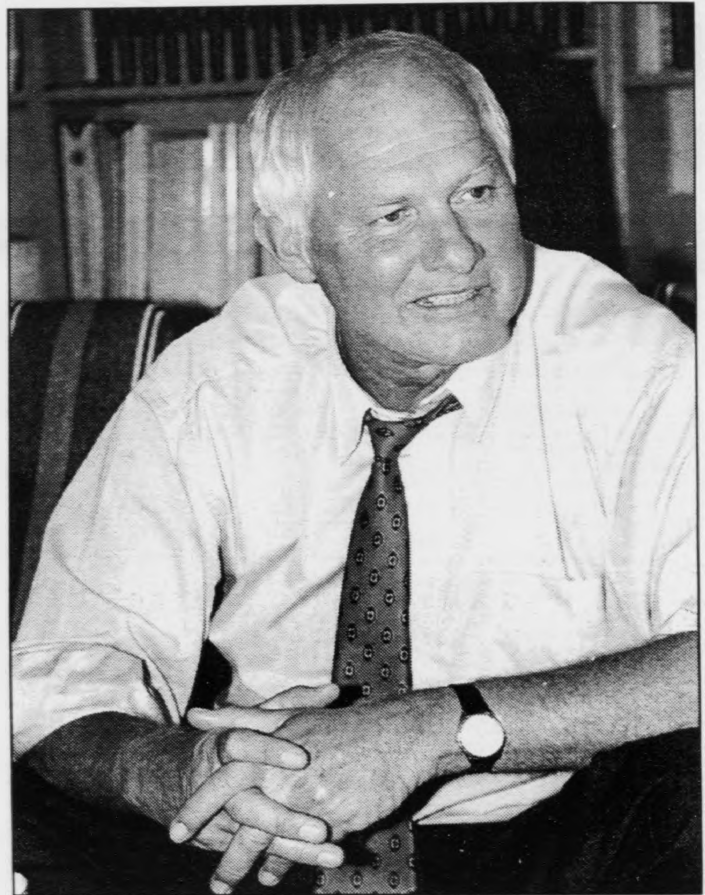
Svend Auken, danski orku- og umhvørvismálaráðharrin vil fegin hjálpa føroyingum í sambandi við eina komandi oljuvinnu, men íntiativið má koma frá føroyingum sjálvum.

-Eg veit, at tað hevur verið tosað um í Føroyum,