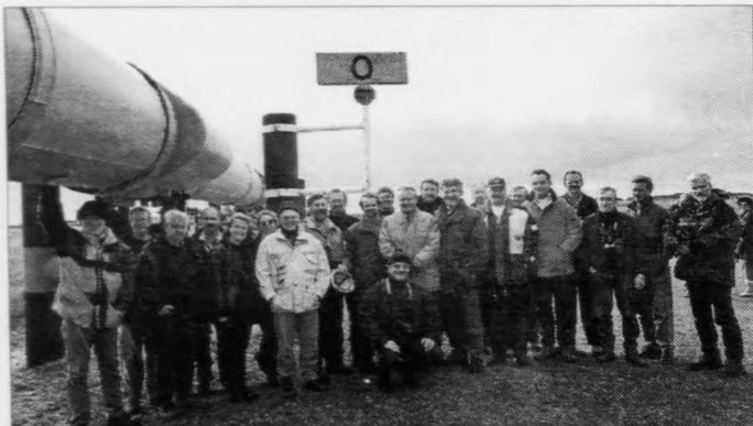
Føroyska ferðalagið saman við vertunum við byrjanina av Trans Alaskan Pipeline í Prudhoe Bay