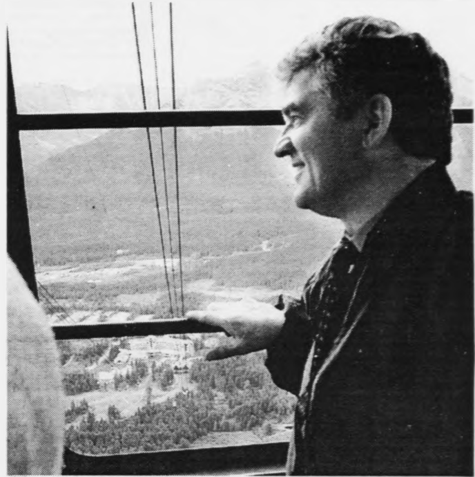
Útsýnið úr einum slíkum kassa er heilt einastandandi, men tað ræður um at halda sær fast og vera verandi innanborða