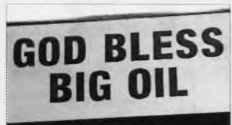
Var tað nakar sum segði, at oljan ongan týðning hevur