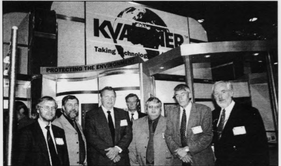
Løgmaður og oljumálaráðharrin vitja á básinum hjá norsku stórfyrirkøni Kværner. Her saman við umboðum fyri Kværner og teimum trimum oljufeløgum Saga, Statoil og Norsk Hydro.

Løgmaður kom víða um á ferð síni í Noregi. Eftir at hava vitjað í Oslo og tosað um felags áhugamál á eitt nú fiskivinnuøkinum og í sambandi við ES, snúði restin av túrinum seg mest um oljumál. Løgmaður vitjaði á oljupallinum Snorre, sum Saga Petroleum rekur. Hann vitjaði eisini á oljuráðstevnu í Stavanger, har