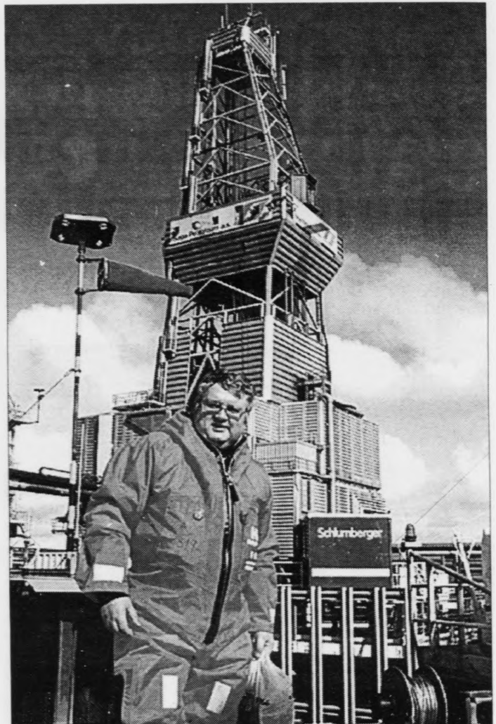
Týsdagin setti Anfinn Kallsberg, løgmaður, fyrri fyrstu ferð, beinin á ein oljuboripall. Hetta hendi, tá hann var og vitjaði norska pallin Snorre, sum liggur í miðjum Norðsjógv.

Saga Petroleum, sum er operatorur. Tvs. at tað er henda fyrirtøkan, sum stendur fyri vitjan lögmanns. Og sigast má at her gekk alt