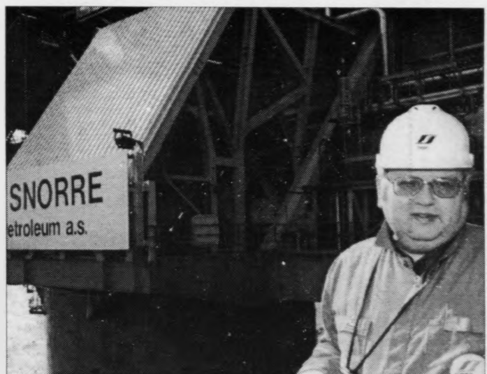
Tað er Saga Petroleum, sum eigur Snorra, og teir eru eins og aðrar altjóða oljufyrirøkur sera ahugaðir í eini møguligari oljuvinnu við Føroyar