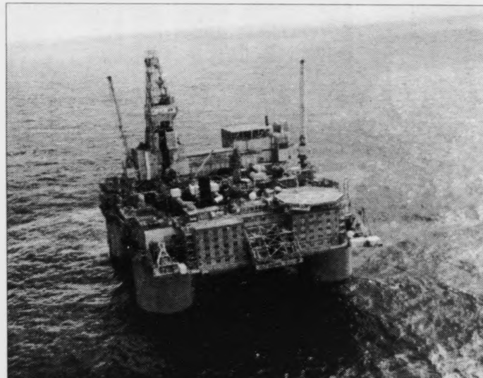
Soleiðis sær hann út; Snorre, og mann hevur hug at geva lögmanni rætt, tá hann tosar um stórar og ógvusligar installatióinir

– Nú var tað gott veður, har vóru góðar umstøður og