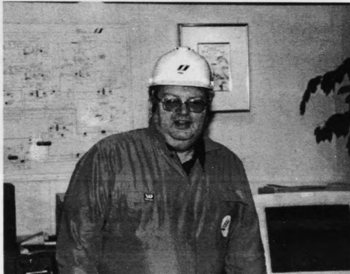
Oljувinnan er so stør í vavi, at eg dugi illa at ímynda mær so stórar installatióinir við Føroyar, sigur Anfinn Kallsberg, løgmaður

– Hetta var ómetaliga stórt í vavi, og eg dugi ikki rættiliga at ímynda mær so stórar installatióinir rundan um Føroyar, men man skal helst longu nú byrja at venja seg við tankan, sigur Anfinn Kallsberg, løgmaður eftir at hava verið á sín- um fyrsta túri á einum oljupalli til havs. Og helst er hetta eisini fyrstu ferð í heila takið, at ein føroyskur løgmaður er gestur á einum oljupalli offshore