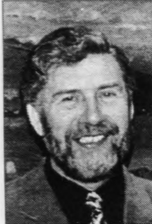
Okkara oljumálaráðharrin, Eyðun Eltør skal m. a. hitta norska oljumálaráðharrin, Marit Arnstad og bretska oljumálaráðharrin, John B. attle

Tað er norski forsætisráðharrin, sum hevur boðið Ánnfinni Kallsberg at vitja, meðan starvsbróðurin, norski orku- og oljumálaráðharrin, Marit Arnstad, hevur boðið Eyðun Eltør at vitja. Innbjóðingin, sum longu varð ætlað undanfarna lögmanni, Edmundi Joensen, sum tá eisini umsát