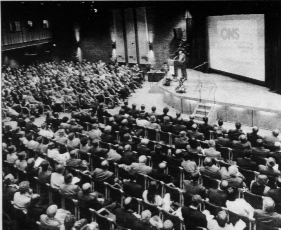
A myndini sæst Haraldur Kongur seta einu oljusstevnu

Stóra aljóða oljuframsýningin og ráðstevnan ONS er annaðhvørt ár. Hundræðtals fyrirtøkur í oljuvinnuni kring allan heim luttaka við øllum hugsandi vørum og tænastu, sum eru í hesi vinnu. Evnið á ráðstevuni hesaferð er m.a. umhvørvi. Føroysku luttakararnir á oljumessuni í Stavanger koma heim aftur friggjakvöldið.